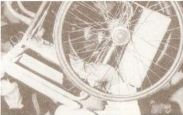
На собраниях нет ничего необычного, когда люди бросают на сцену костыли, трости и даже инвалидные коляски, как знак силы Бога, творящего чудеса.