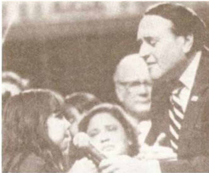
Глухая девочка исцелена и говорит, “мама” в самый первый раз!